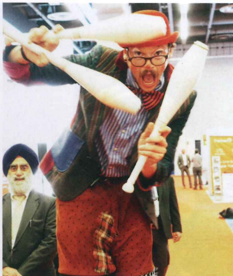
Für Unterhaltung zwischen den Gesprächen und Vorträgen sorgte dieser Gaukler.