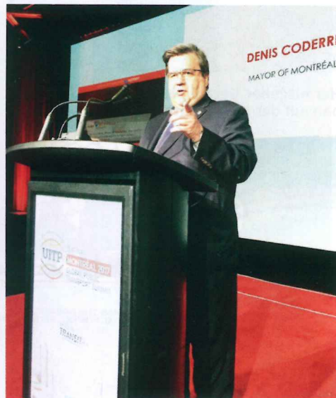
„Wir bauen Brücken statt Mauern“ - in seiner Rede warb Denis Coderre, Bürgermeister von Montréal, um den Klimaschutz.